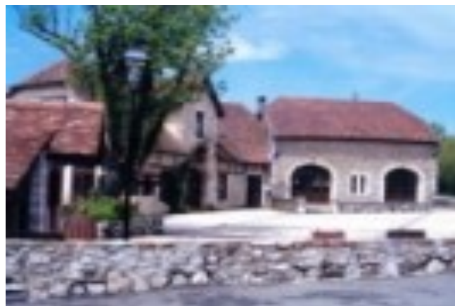
Mairie et salle des fêtes

Lundi de 10h30 à 12h30. Jeudi de 16h30 à 18h30.