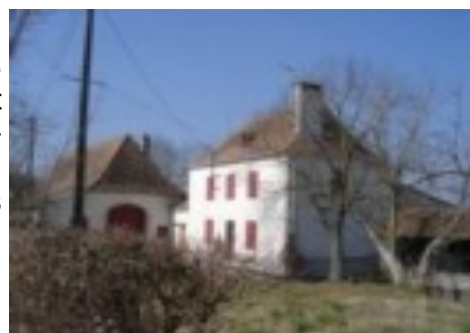
Maison béarnaise

Le maire et la commune de Castetner conservent la maîtrise des décisions en matière d'urbanisme, en particulier pour les permis de construire.