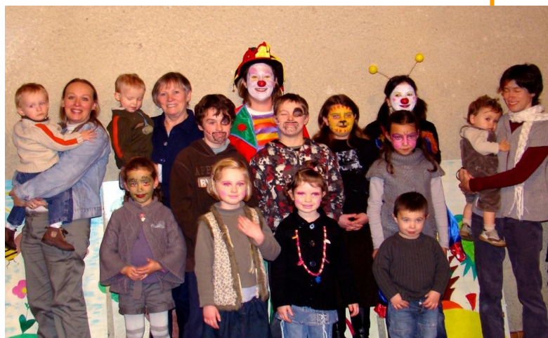
Goûter du CCAS du 4 janvier 2008